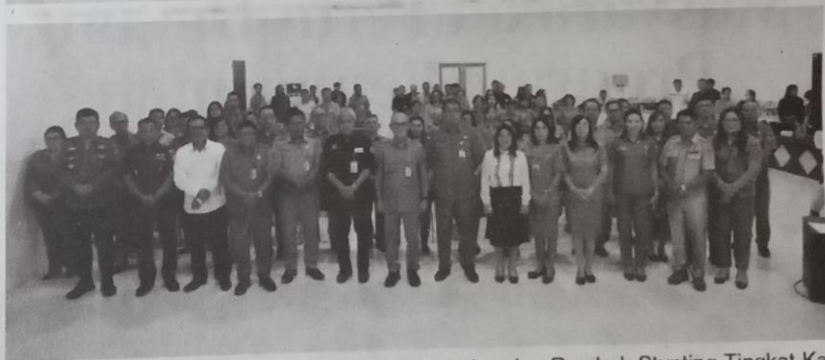
BEKERJA: Rakor Percepatan Penurunan Stunting dan Rembuk Stunting Tingkat Kabupaten, Selasa (2/4).